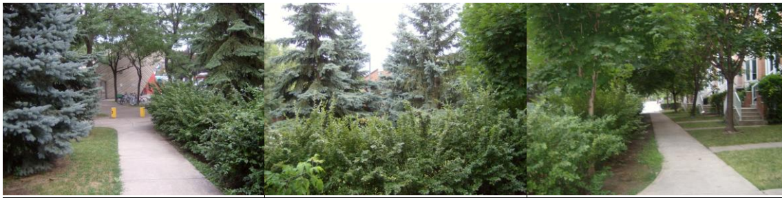
Le passage qui mène du métro... (la rue Caisse derrière les arbres) ...vers le boulevard LaSalle.

plus sécuritaire à son point de vue. Les participants ont également remarqué que les arbres servaient d'abri en cas de pluie, ce qui accentue l'achalandage devant leurs résidences. Ce petit coin de parc est tellement dense qu'il donne un faux sentiment d'intimité , ce qui amène différentes problématiques relevées par les participants. Ainsi, certaines personnes y viennent pour parler au téléphone cellulaire (dérangeant les résidents des condos) , d'autres y viennent pour se quereller, consommer de la drogue ou encore pour dormir , (au dire d'un participant, un homme y a passé deux nuits).